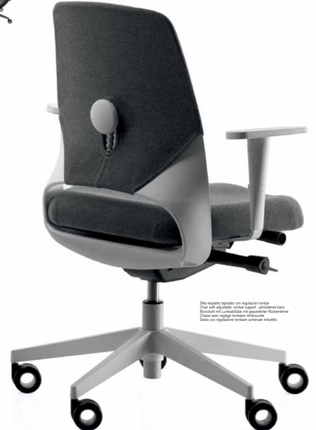
Silla respaldo tapizado con regulación lumbar Chair with adjustable lumbar support upholstered back Bürostuhl mit Lumbalstütze mit gepolsterter Rückenlehne Chaise avec réglage lombaire rembourrée Sedia con regolazione lombare schienale imbottita