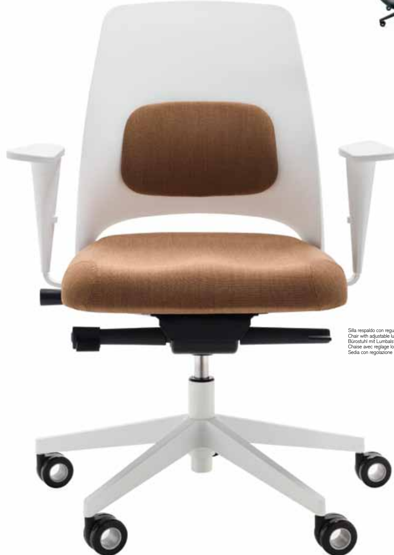
Silla respaldo con regulación lumbar tapizado frontal Chair with adjustable lumbar support front upholstery Bürostuhl mit Lumbalstütze mit Polsterauflage Chaise avec réglage lombaire rembourrage frontal Sedia con regolazione lombare imbottita