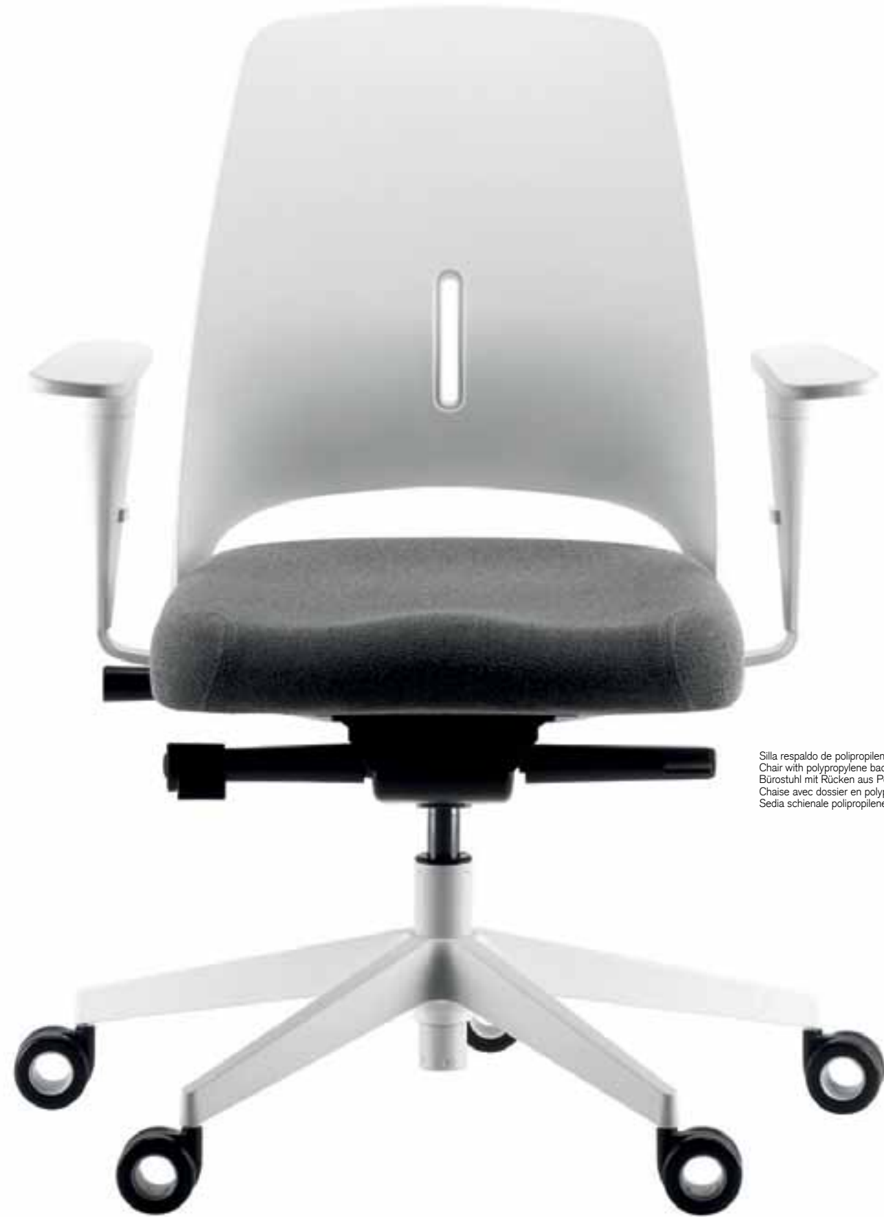
Silla respaldo de polipropileno Chair with polypropylene back Bürostuhl mit Rücken aus Polypropylen Chaise avec dossier en polypropylène Sedia schienale polipropilene